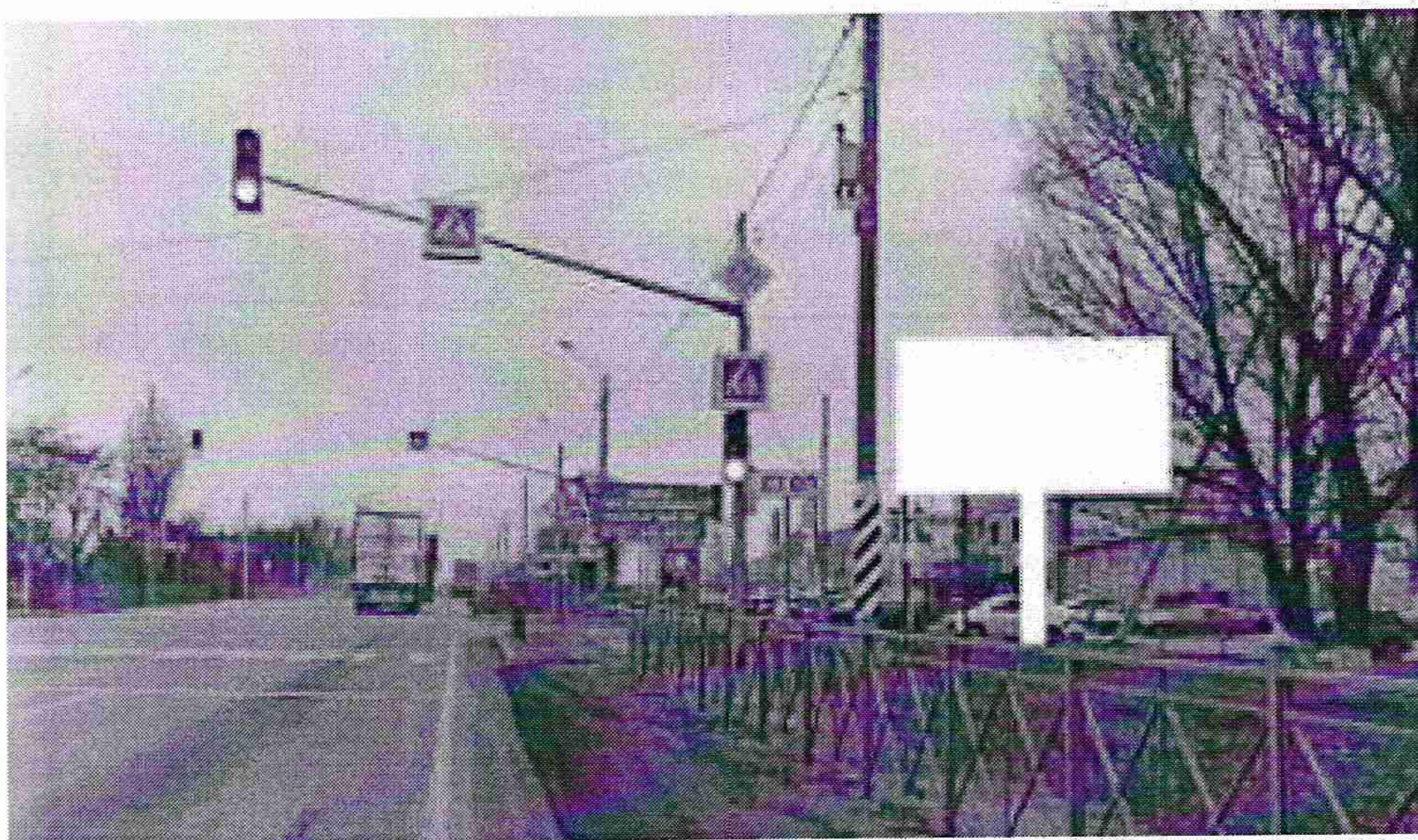
Эскиз рекламной конструкции